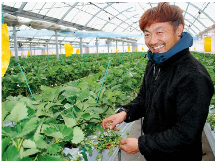
▲収穫シーズンに向けて、準備中の農園(12月撮影)

株式会社ヤナイ園芸 (@yanai8786engei) ▶ YANAI8786ENGEI